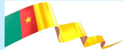
Plan de Promotion de l'emploi des jeunes

main d'œuvre, au profit des jeunes sur toute l'étendue du territoire. Ceci se fera en